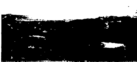
Fotos No 1 a 2, Ecosistemas naturales presentes en los predios visitados ( RNSC a denominarse "Monayano"); vereda San José, municipio de Gachancipá, Cundinamarca (Enero 11 de 2017)