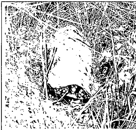
Fotografía 5: Chelonoidis carbonaria (Morroco o tortuga de patas rojas) especie en estado de conservación amenazada y categoría En Peligro, según la IUCN.

Dentro del predio es muy probable la presencia importante de fauna típica de la región de los llanos orientales y de las selvas orinoquenses, que incluye especies como mico maicero ( Cebus apella ), mono araguato ( Alouatta seniculus ), mono ardilla ( Saimiri sciureus ), venado sabanero ( Odocoileus virginianus ), cachicamo ( Dasybus novemcinctus ), león ( Puma concolor ), perdicero ( Boa constrictor ), guio negro ( Eunectes murinus ), rana platanera ( Hypsiboas crepitans ), sapo común ( Rhinella marina ), así como diversas especies de aves asociadas a los variados hábitats presentes. Un aspecto importante es la existencia de algunas especies catalogadas en estado de amenazada como Chelonoidis carbonaria (Morroco o tortuga de patas rojas) (ver fotografía 5), el oso palmero ( Myrmecophaga tridactyla ), danta ( Tapirus terrestris ) (ver fotografía 6), ocarro ( Priodontes maximus ), lo que sugiere que la zona aún presenta condiciones ecosistémicas y hábitats que favorecen su presencia. (Folio 140)