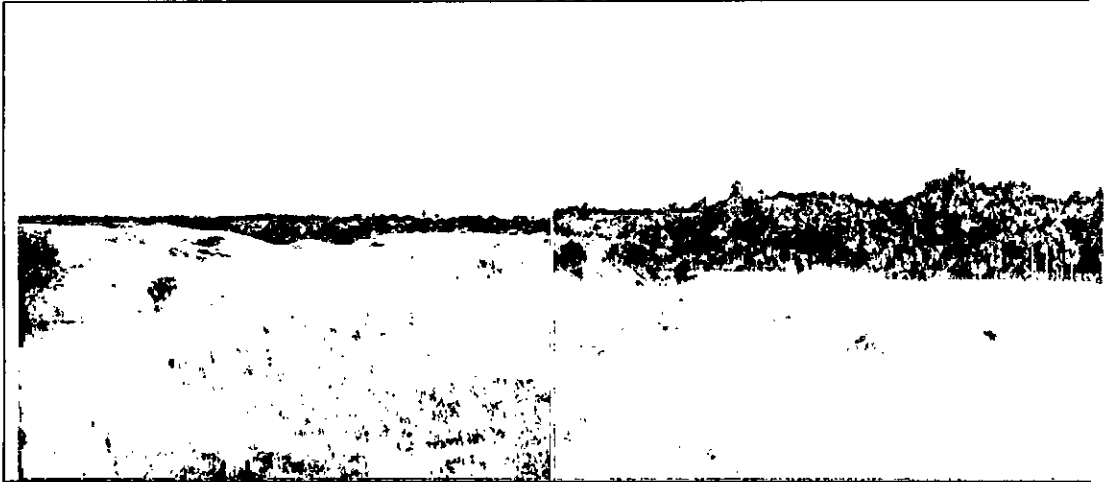
Fotografía 1: Sabana transicional sobre suelos bien drenados.

Las demás áreas perteneciente a la estructura ecológica principal del predio la conforman las sabanas estacionales sobre suelos secos bien drenados (ver fotografía 1) con dominancia de Heteropogon contortus y Paspalum pectinatum , y en muy poca proporción parches de sabanas hiperestacionales abiertas sobre suelos mal drenados o húmedos (ver fotografía 2) dominadas por Bulbostylis con presencia de Drosera sessilifolia y D. cayenensis .