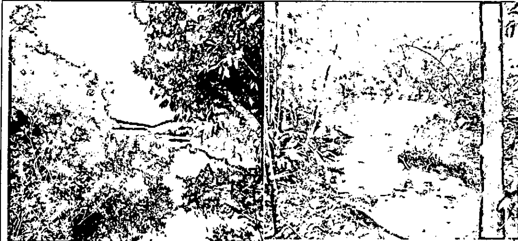
Fotografía 3: Bosque de galería asociado a madreveja sobre la margen derecha del Rio Bitá.