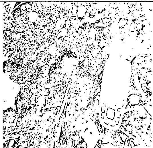
Fotografía 6: Huella indicador de presencia de Tapirus terrestris (danta).

(Predio El Rincón de Anel, Municipio de Pto