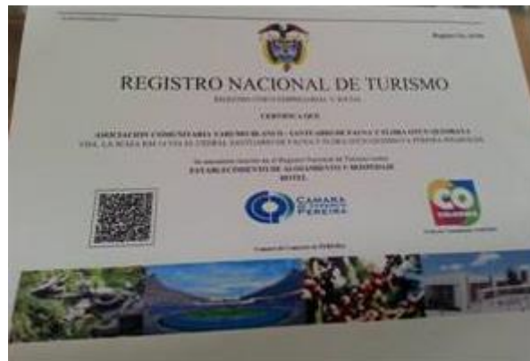
Imagen 5: Registro Nacional de Turismo RUNT – Asociación Comunitaria Yarumo Blanco.