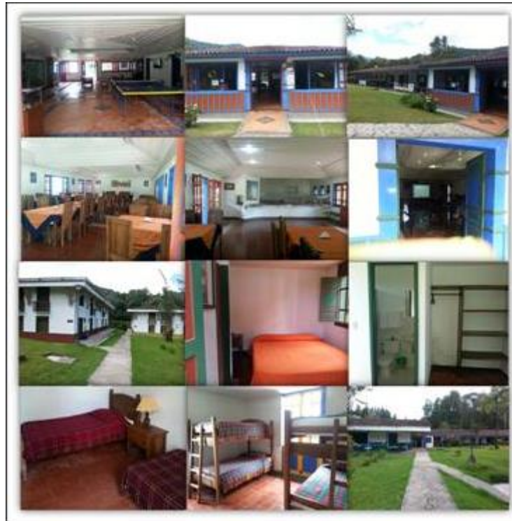
Imagen 4: Instalaciones para prestación de servicios ecoturísticos comunitarios.