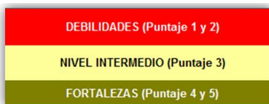
Imagen 2: Rango de Valores para Priorizar las Necesidades y Fortalezas de Manejo de AP (AEMAPPS 2013).