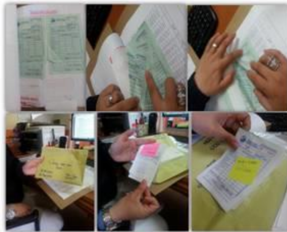
Imagen 3: Vales de combustible consumidos y pendientes por consumir.

Para el suministro de combustible de la camioneta se utiliza el sistema de lbuto y también se utilizan los vales.