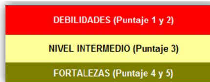
Imagen 2: Rango de Valores para Priorizar las Necesidades y Fortalezas de Manejo de AP (AEMAPPS 2013).