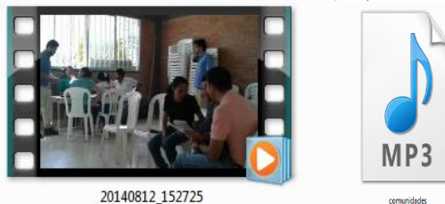
Imagen No.1: Pantallazo de video y clip radial