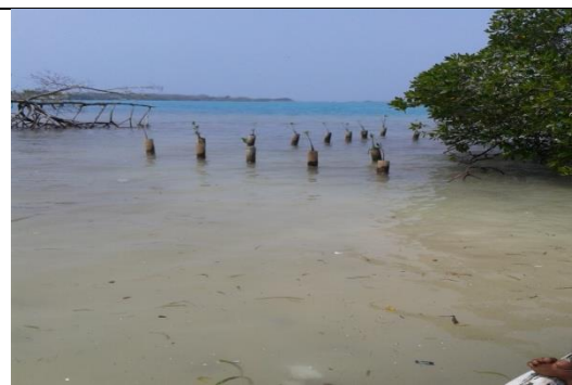
Recuperación de zona de manglar de la playa por parte del grupo y con apoyo y coordinación de PNN.