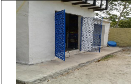
Reparación puerta bodega torres.