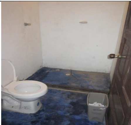
Antes los baños de la casa VIP sin enchape y sin funcionamiento.