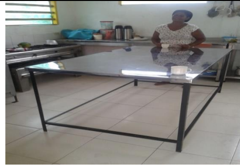
Adquisición de mesón en acero inoxidable por parte de la Empresa Comunitaria.