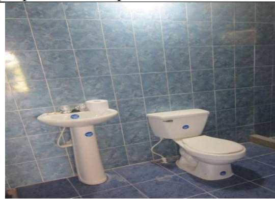
Después del enchape, baños de casa VIP.