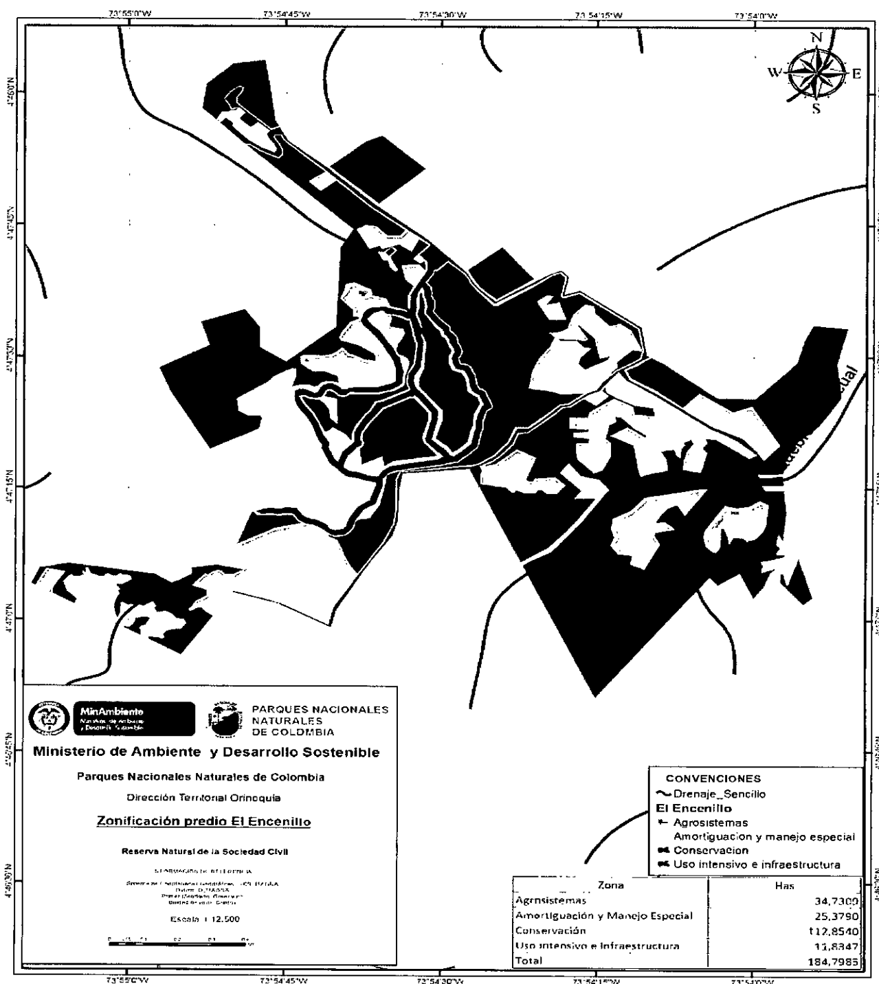
Mapa elaborado por Pablo Cabrera Patiño Profesional SIG-DTOR