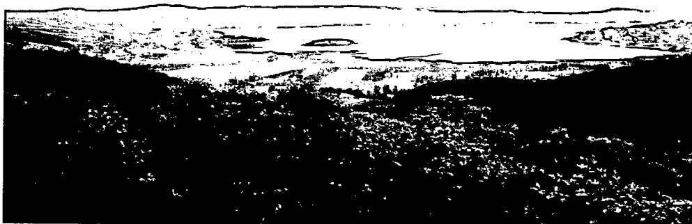
Imagen 1. Vista general desde el costado norte del Humedal Ramsar Laguna de La cocha, con el Santuario de Fauna y Flora Isla de La Corota.

1. Características generales del predio: El predio EL LAUREL se encuentra localizado en la vereda San José del corregimiento de El Encano, en jurisdicción del municipio de Pasto, a aproximadamente 25 Km de su cabecera municipal. El predio se ubica en la zona de influencia del Santuario de Flora y Fauna Isla de La Corota, que hace parte del Humedal Ramsar Laguna de La Cocha, y a su vez hace parte de la Reserva Forestal Protectora Laguna de La Cocha- Cerro de Patascoy, declarada mediante acuerdos No. 005 de 1971 y No. 058 de 1973 y resoluciones ejecutivas No. 231 de 1971 y No. 073 de 1974 del Ministerio de Agricultura.