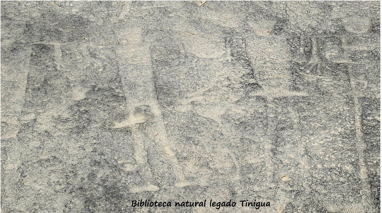
Biblioteca natural legado Tinigua

No hacer grafitis: Rayar las rocas o resaltar los dibujos rupestres es un acto vandálico que produce un daño irreparable. Esto perjudica la visibilidad de arte rupestre y evita la posibilidad de realizar estudios especializados.