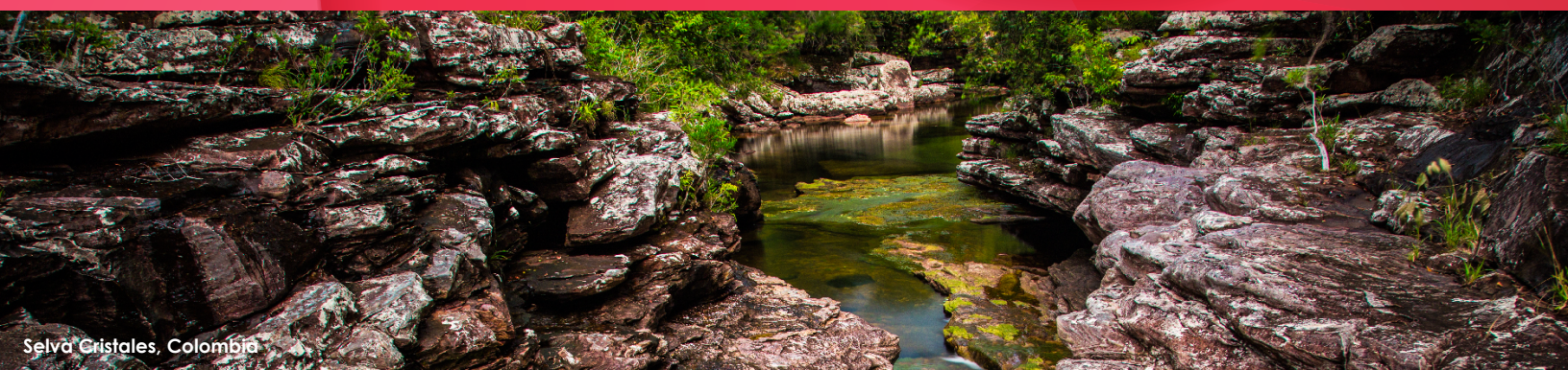
Selva Cristales, Colombia

Entidades y Comunidad del Turismo de la Macarena (Meta), 2019