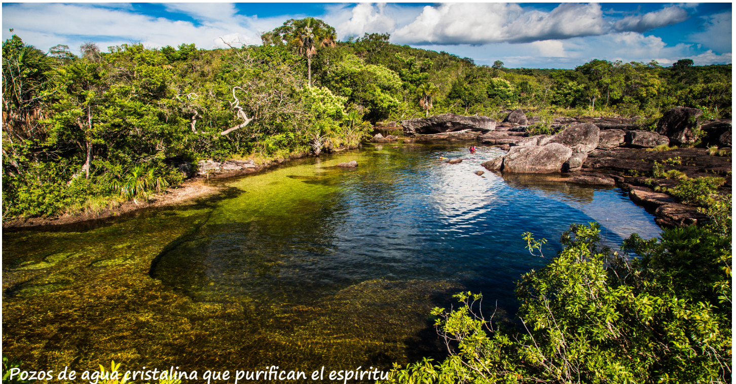
Pozos de agua cristalina que purifican el espíritu

El Raudal de Angosturas I cuenta con una afluencia hídrica muy importante para la región y para el municipio de La Macarena, siendo el río Guayabero, la principal ruta de desplazamiento para la población y la fuente de alimento más importante por la provisión de recursos hidro-biológicos los cuales encuentran en el “Cajón” la posibilidad de reproducirse y tener una hábitat que mantenga el equilibrio de las especies . El río Guayabero tiene un ancho promedio de 200 metros en su recorrido, sin embargo, en el Raudal de Angosturas I, se forma un “Cajón” de piedra de aproximadamente 2,7 km de longitud que reduce el cauce del mismo entre 30 y 40 m de ancho, lo cual aumenta su velocidad y sirve como refugio para especies de peces que vienen en época de reproducción.