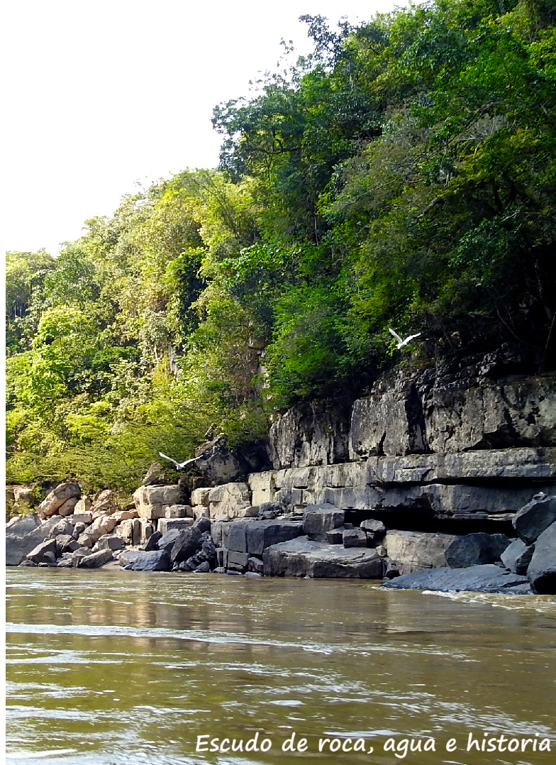
Escudo de roca, agua e historia

En términos turísticos, este lugar representa para el municipio de La Macarena un importante aporte pues se constituye en un atractivo turístico sin estacionalidad, que actualmente se viene experimentando al depender de un escenario turístico como lo es Caño Cristales, abierto a los visitantes en época de lluvias que normalmente de junio a diciembre, y es una oportunidad para incluir nuevas comunidades de la zona en actividades legales y formales, disminuyendo las presiones que por otras actividades se experimentan en el sector vulnerando la integridad ecológica del territorio.