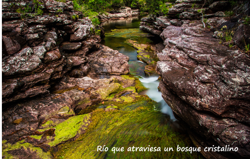
Río que atraviesa un bosque cristalino