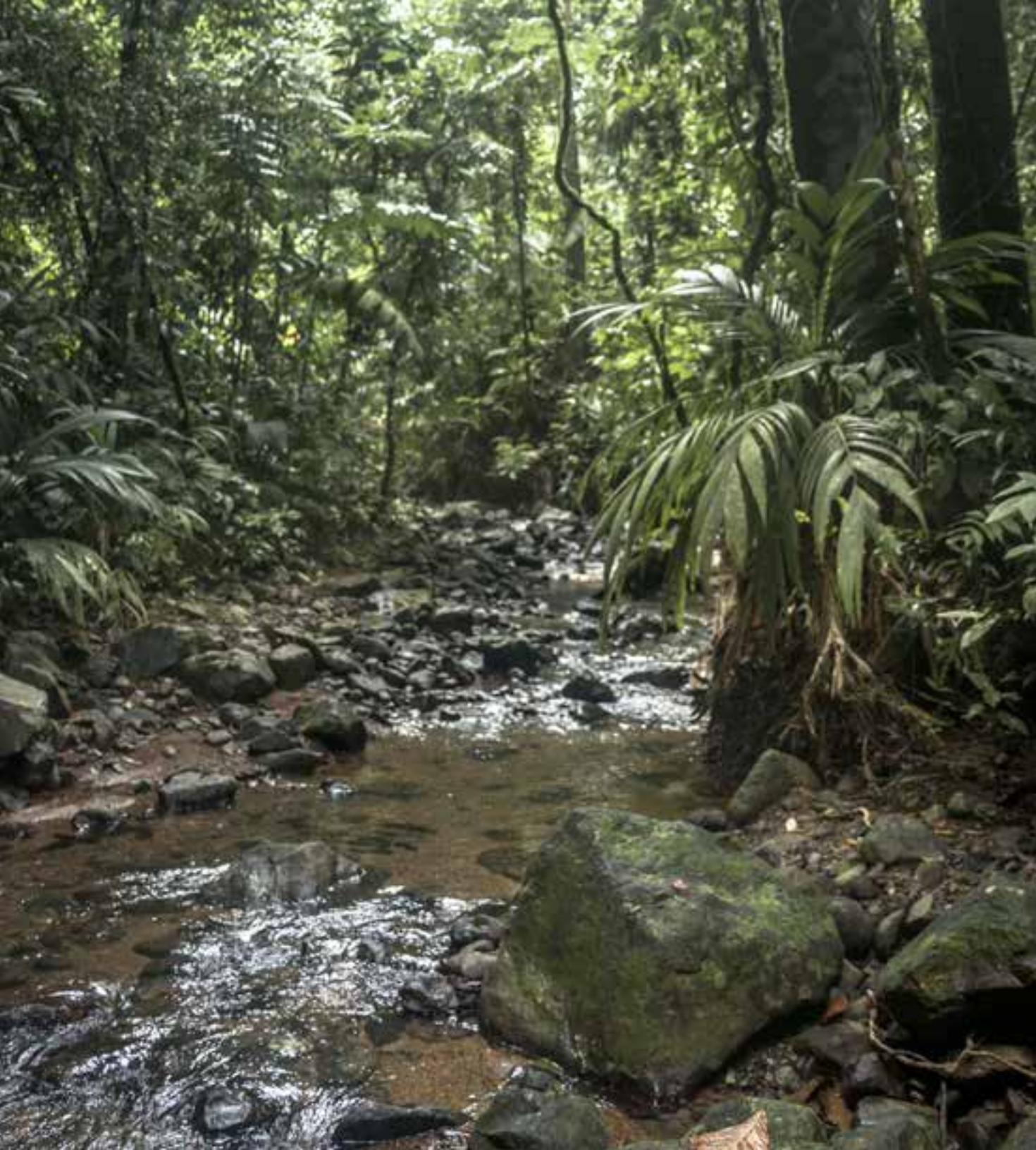
Parque Nacional Natural Utría